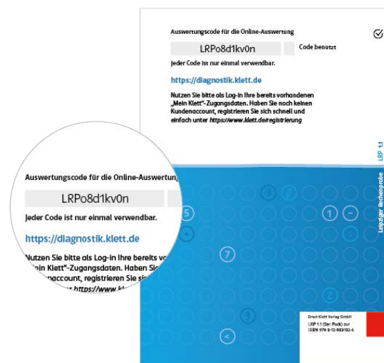
Testheft mit Auswertungscode

Für die Eingabe der Testdaten benötigen Sie einen Auswertungscode, den Sie auf der Rückseite des Testhefts finden.