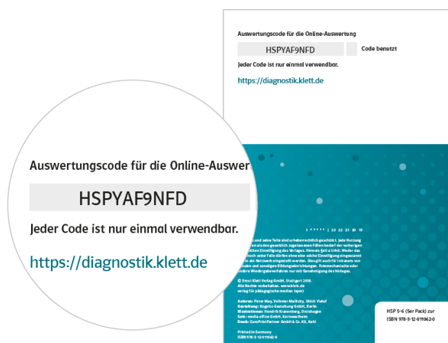
Testheft mit Auswertungscode

Für die Eingabe der Testdaten benötigen Sie einen Auswertungscode, den Sie auf der Rückseite des Testhefts finden.